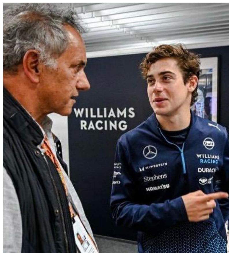
Daniel Scioli se reunió con Franco Colapinto el año pasado

El proyecto incluye una renovación integral del autódromo para cumplir con los estándares de