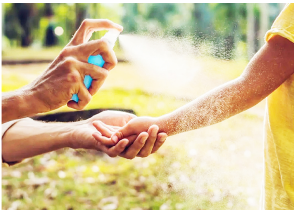
Vacaciones cuidadas. Una caída, un golpe o un corte pueden suceder en cualquier momento.

Cuando las picaduras son de mosquito, suelen aparecer enrojecimiento, picazón y ligera inflamación. En estos casos hay que lavar la picadura con agua