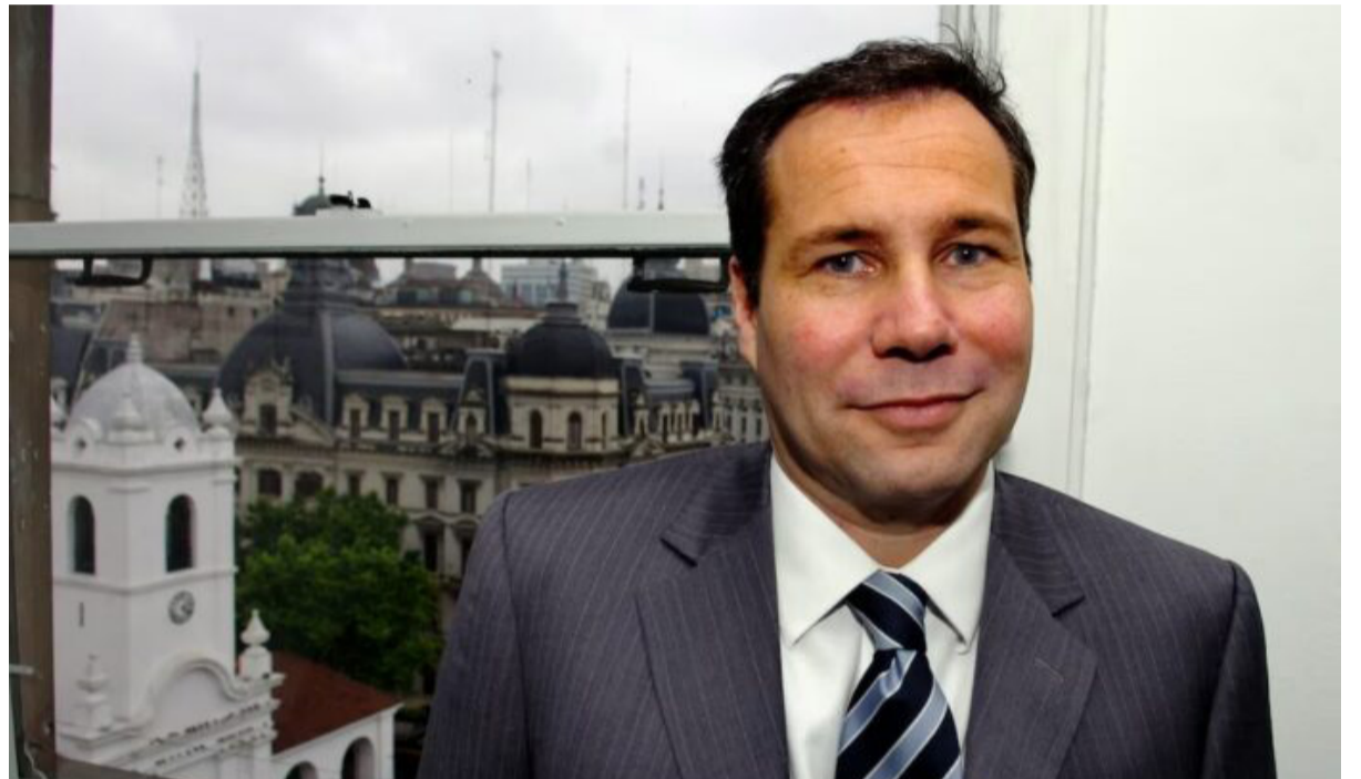
El fiscal Alberto Nisman fue hallado muerto el 18 de enero de 2015.

El comunicado cierra: “Desde el Poder Ejecutivo se mantiene la confianza en que el Poder Judicial continúe con las investigaciones correspondientes para que el asesinato