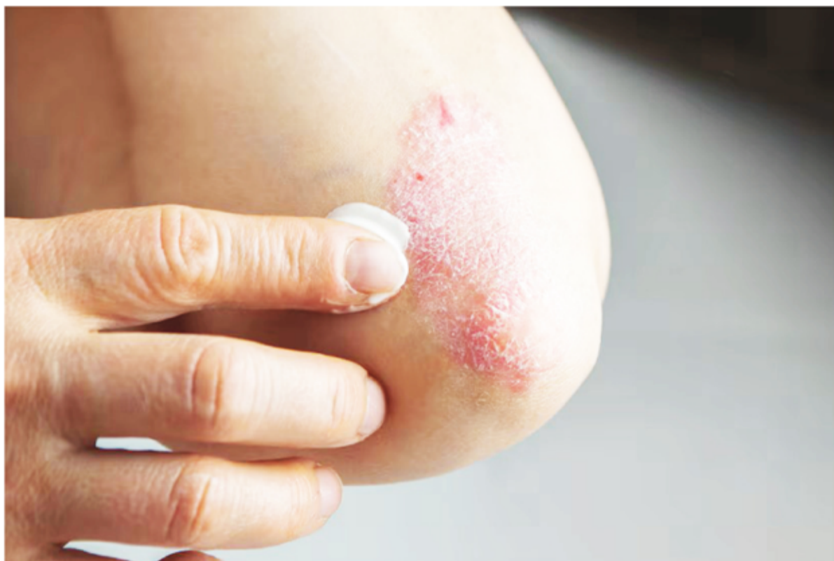
Escamas. Si bien la psoriasis es incurable, hay tratamientos y hábitos que mejoran la salud de quienes la padecen.

En Argentina hay unas 800.000 personas afectadas por esta enfermedad que se cree que es provocada por el sistema inmune. Tips para vivir mejor.