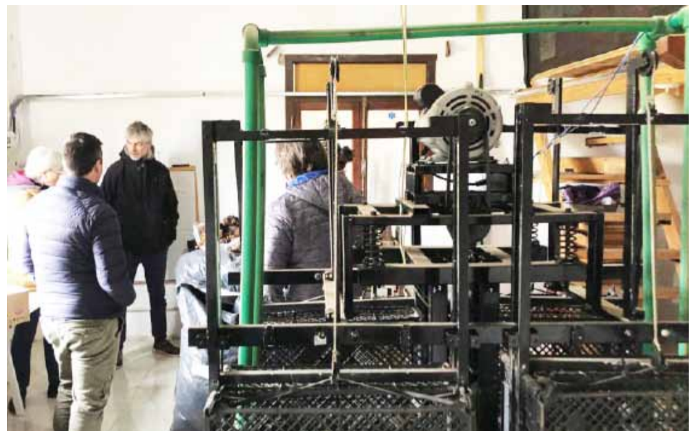
El lavadero instalado en Villa Moll.

Este tipo de fibra no suele ser del interés de los acopiadores por su escaso valor en el mercado, ya que las sintéticas, en su mayoría de origen chino, compiten con la lana gruesa, y tienen menor costo.