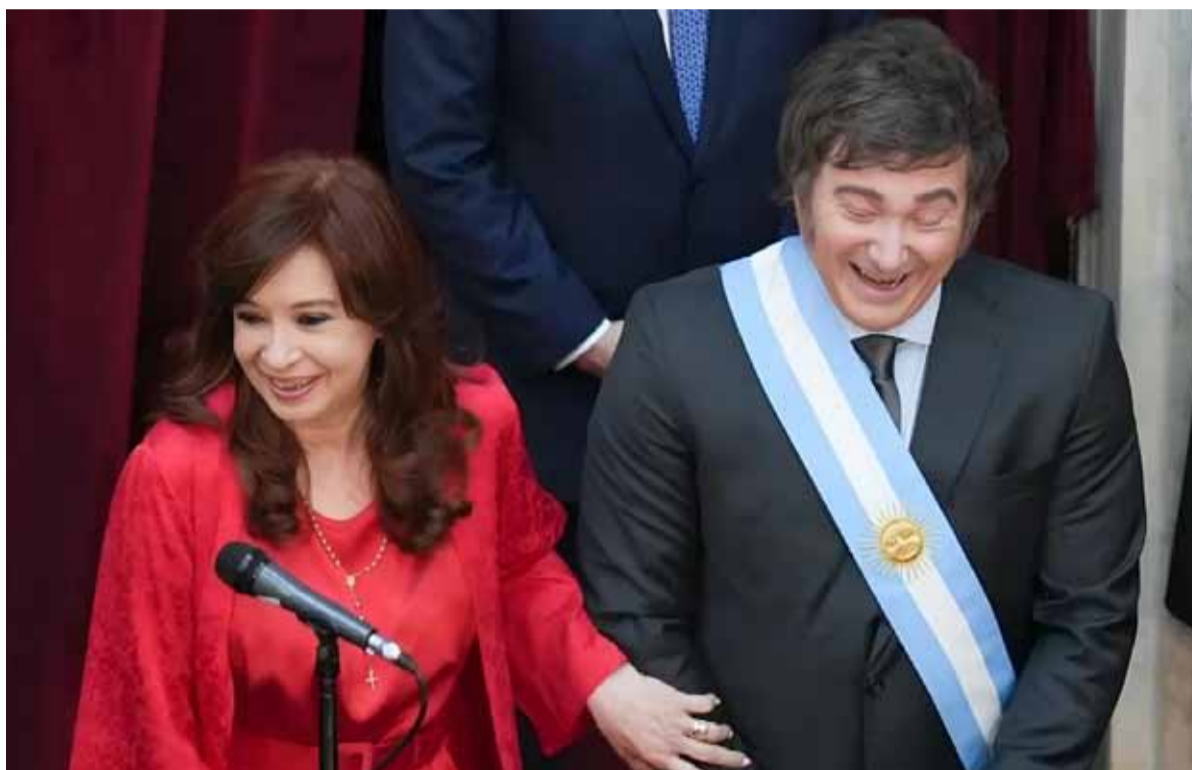
Cristina Fernández de Kirchner y Javier Milei.

caso de aprobarse, dejaría afuera una posible candidatura de Cristina Fernández de Kirchner. La exmandataria tiene una condena en segunda instancia a 6 años de prisión confirmada en noviembre de 2024 por la Cámara Federal de Casación Penal.