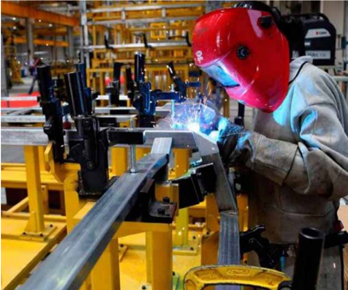
La industria, que representa el 18,7% del empleo privado, sufrió una pérdida neta de 25.186 puestos.

Un informe del Centro de Economía Política Argentina (CEPA) revela una significativa destrucción de puestos de trabajo en el sector privado desde la asunción de Milei. La industria, que representa el 18,7% del empleo privado, sufrió una pérdida neta de 25.186 puestos.